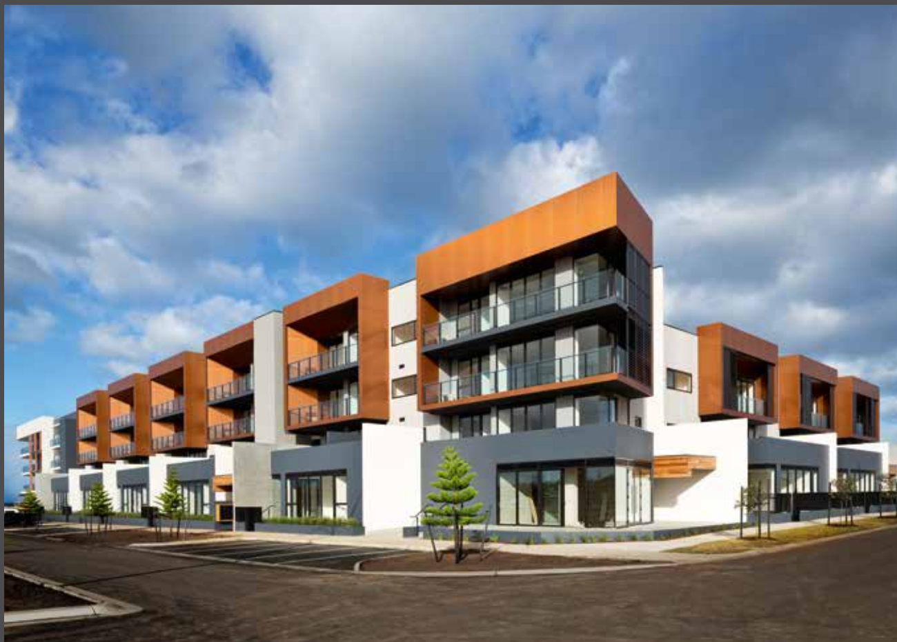
Wyndham Harbour, Australia | Arquitecto: Fender Katsalidis | Material: ALUCOBOND® PLUS naturAL Copper | © Angus Martin Wyndham Harbour, Austrália | Arquitecto: Fender Katsalidis | Material: ALUCOBOND® PLUS naturAL Copper | © Angus Martin