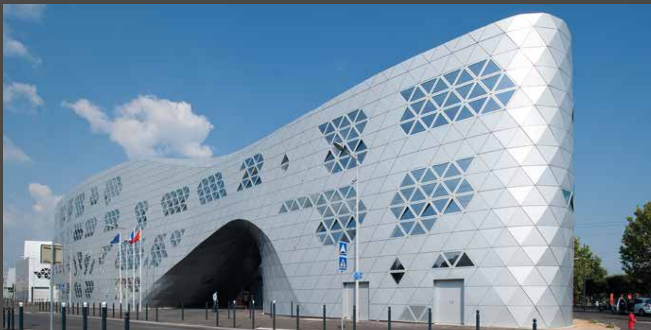
Lycée Georges Frêche, France | Architect: Massimiliano and Doriana Fuksas, Rome, Paris | Fabricator: Tim Composites, SMAC Toulouse Material: ALUCOBOND® anodized look C0/EV1

Die Verwendung hochwertiger Fluorpolymer-Lacksysteme, die in einem kontinuierlichen Lackierverfahren (coil coating) appliziert werden, garantiert die kompromisslose Verwirklichung des ursprünglichen Designs.